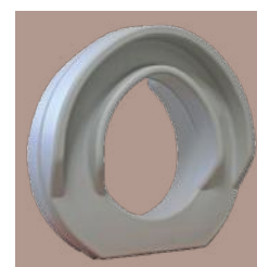
Fixation sans vis ni outils